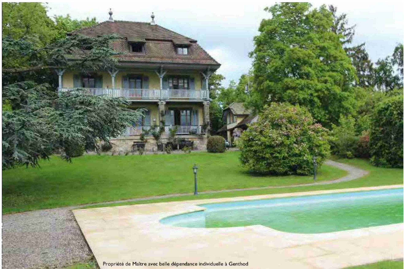
Propriété de Maître avec belle dépendance individuelle à Genthod